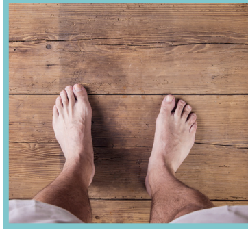
لا ترتدي الحذاء داخل المنزل