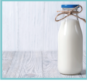
تناول الطعام الغني بالكالسيوم والحديد